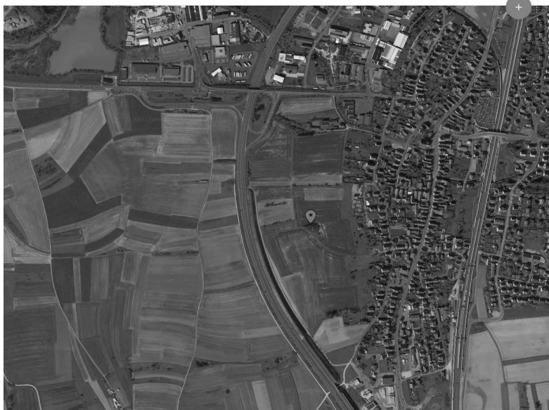
planundwerk · TMI Rahmenplanung "Grünes Gewerbe- und Mischgebiet östlich der A73" Gemeinde Breitengüßbach

Sie können die Online-Beteiligung über die digitale Pinnwand bis zum 31.10.2021 nutzen, um sich in den Beteiligungsprozess einzubringen. Mithilfe des beigefügten QR-Codes gelangen Sie auf die Pinnwand, auf der Sie Ihre Beiträge hochladen können. Scannen Sie den Code einfach mit dem Smart-Phone! Alternativ können Sie über die Internetseite über folgenden Link aufrufen: www.padlet.com/planundwerk/uxmd71swsscgsbj Wer möchte darf auch gerne an die Gemeindeverwaltung direkt schreiben.