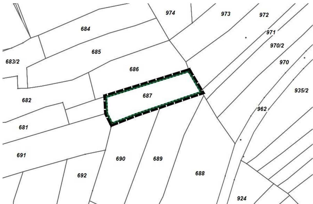
Lageplan Teilfläche Flur-Nr. 687, Gemarkung Unteroberndorf