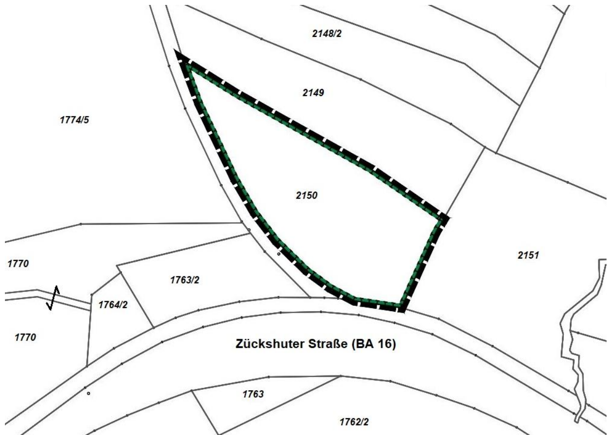
Lageplan Flur-Nr. 2150, Gemarkung Breitengüßbach

Dem Bebauungsplan sind als Ausgleichsflächen für Ersatzmaßnahmen die Flur-Nr. 2150, Gemarkung Breitengüßbach, und eine Teilfläche der Flur-Nr. 687, Gemarkung Unteroberndorf, zugeordnet. Die genaue Lage kann den nachfolgenden Lageplänen entnommen werden.