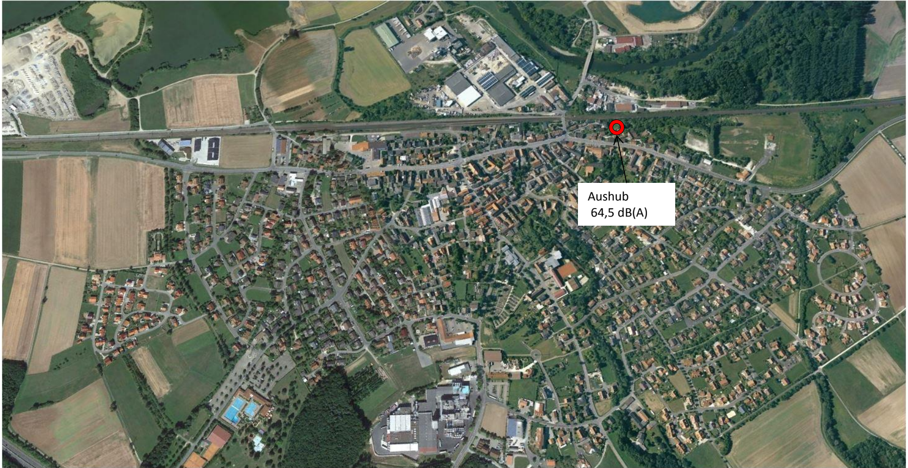
Darstellung der gemittelten Schallpegel während repräsentativen Bauarbeiten im Zeitraum 15.02.2016 bis 26.02.2016